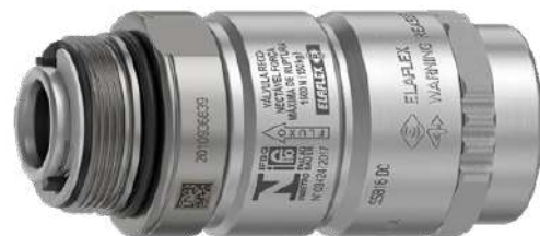
SSB 16 DC