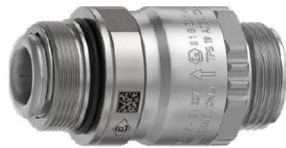
SSB 16 Safety Swivel Break

Reusable, self-closing Safety Swivel Break to EN 13617-2. Designed to protect dispenser, hose assembly and car against damage caused by drive-off incidents. Stops the flow of fuel on the hose end at separation. The 'Nozzle Break' is directly fitted into the nozzle. Suitable for ZVA Slimline 2, ZVA Slimline (old) and other nozzles.