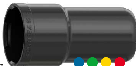
BS 16 Break Sleeve

TECHNISCHE ÄNDERUNGEN VORBEHALTEN · NACHDRUCK UND KOPIEN NUR MIT UNSEREM EINVERSTÄNDNIS · Specifications subject to change without notice · Copyright ELAFLEX HIBY