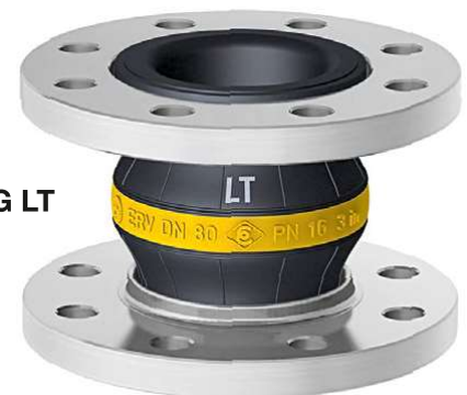
Type ERV-G LT

GELBRING LT -Gummikompensatoren in besonders kältefester Ausführung für normgerechte Mineralölprodukte, z.B. Diesel, Heizöl bis +90°C, Flugkraftstoffe, Petroleum bis +60°C, Otto-Kraftstoffe bis +40°C. Temperaturbereich (medienabhängig) -40°C bis +90°C, kurzzeitig bis +100°C. Elektrisch ableitfähig. Innen : NBR (Nitril), nahtlos, abriebfest Druckträger : PA-Textilcord Außen : Chloropren CR Kennzeichnung : Gelber Ring mit weißem 'LT'-Aufdruck, ERV DN ..., PN 16, Herstellungsdatum Flansche 1) : Drehbar, DIN PN 10/16, Stahl, verzinkt