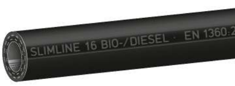
Type Slimline 'SL BIO' Slimline Biodiesel

SLIMLINE quality petrol pump hoses for gasoline and diesel fuels. Also suitable for fuels with ethanol content up to E 85 and Biodiesel up to B30 (BIO Type up to B100). Meets weights and measures regulations, see overleaf. Cold flexible down to -30°C / -22°F (LT-type down to -40°C / -40°F), temp. up to +55°C / +131°F.