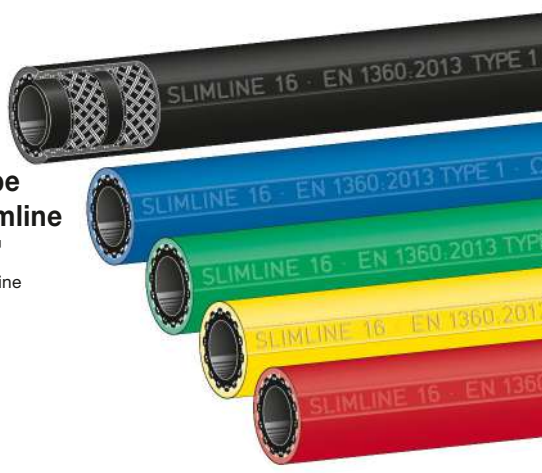
Type Slimline 'SL' Slimline

Innen : NBR schwarz, nahtlos extrudiert, elektrisch ableitfähig, nicht ausfärbend Festigkeitsträger : zwei dehnungsarme Textilgeflechte mit gekreuzten, eingeflochtenen Spezial-Leitfäden Außen : glatt, öl-, UV- und ozonbeständig, hoch abriebfest. Werkstoff siehe Tabelle.