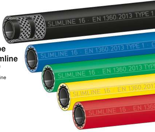
Type Slimline 'SL' Slimline

Innen : NBR schwarz, nahtlos extrudiert, elektrisch ableitfähig, nicht ausfärbend Festigkeitsträger : zwei dehnungsarme Textilgeflechte mit gekreuzten, eingeflochtenen Spezial-Leitfäden Außen : glatt, öl-, UV- und ozonbeständig, hoch abriebfest. Werkstoff siehe Tabelle.