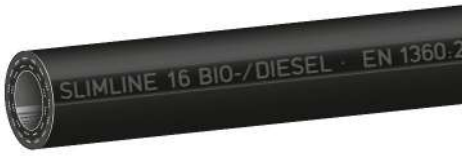
Type Slimline 'SL BIO' Slimline Biodiesel

SLIMLINE quality petrol pump hoses for gasoline and diesel fuels. Also suitable for fuels with ethanol content up to E 85 and Biodiesel up to B30 (BIO Type up to B100). Meets weights and measures regulations, see overleaf. Cold flexible down to -30°C / -22°F (LT-type down to -40°C / -40°F), temp. up to +55°C / +131°F.