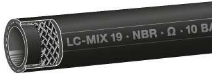
Type LC-Mix Lining NBR electr. dissipative

Economy priced light weight pump hose with textile reinforcement for gasoline, diesel, fuel oil, petroleum. Can not be calibrated.