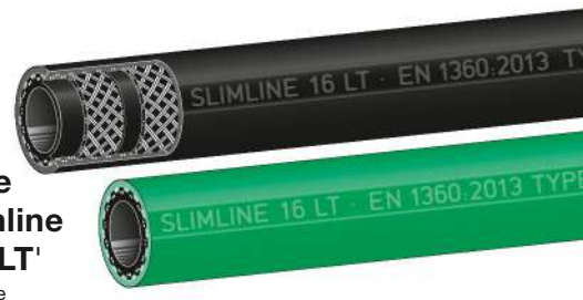
Type Slimline 'SL LT' Slimline Low Temperature